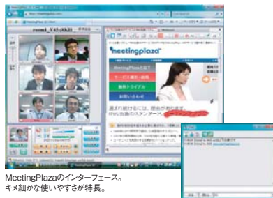
MeetingPlazaのインターフェース。 キメ細かな使いやすさが特長。

*株式会社シードプランニング「2008年度版テレビ会議/Web会議の最新市場動向とHD化傾向」調査報告書(2008年3月)より