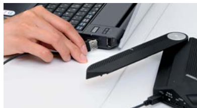
小型で軽量。USBバスパワーにより、PCと接続するだけで使用可能。